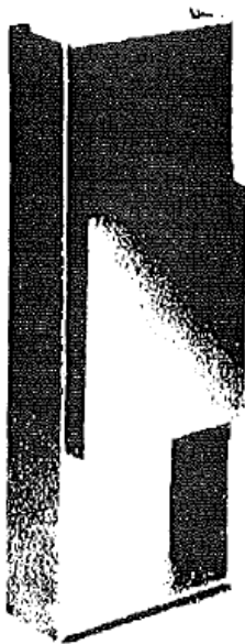
▲ Kosz na śmieci MOROKA z popielniczką, 19 l, do zakotwienia

OPIS: KORPUS Z PIASKOWANEJ STALI PŁASKIEJ